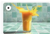
Generate video BETA