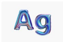
Generate text effects